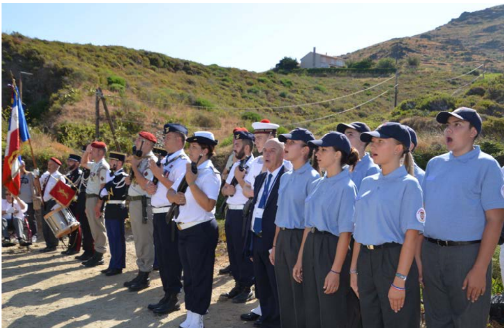
Chant de la Marseillaise par les Cadets de la Défense