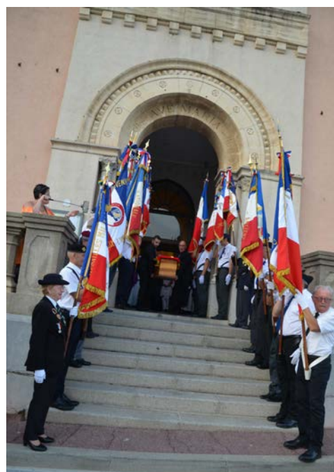
Haie d'honneur à la sortie de la messe