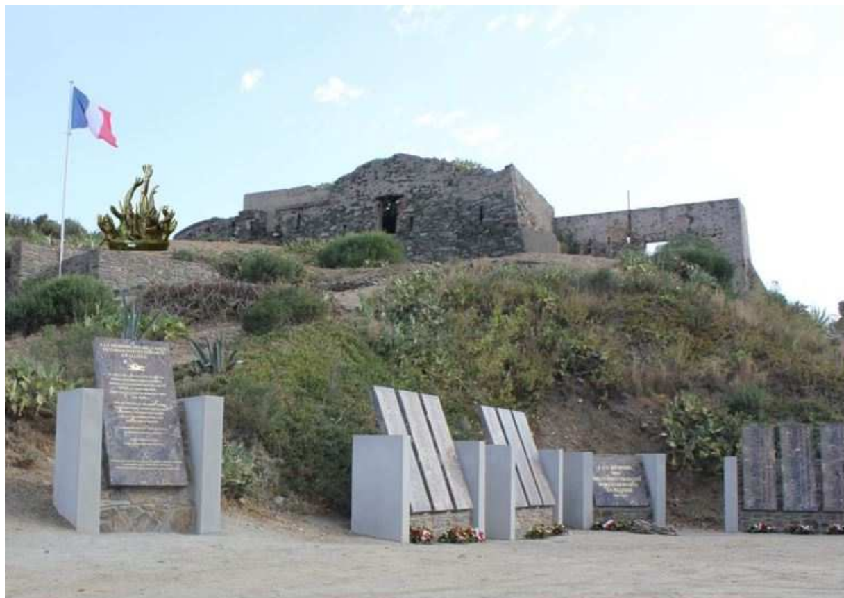
Vue générale du monument dans sa configuration finale

Installé sur le flanc de la redoute Mailly, qui défendait autrefois l'accès au port de Port-Vendres, le monument fait face au port et domine la mer qui vient battre à ses pieds.