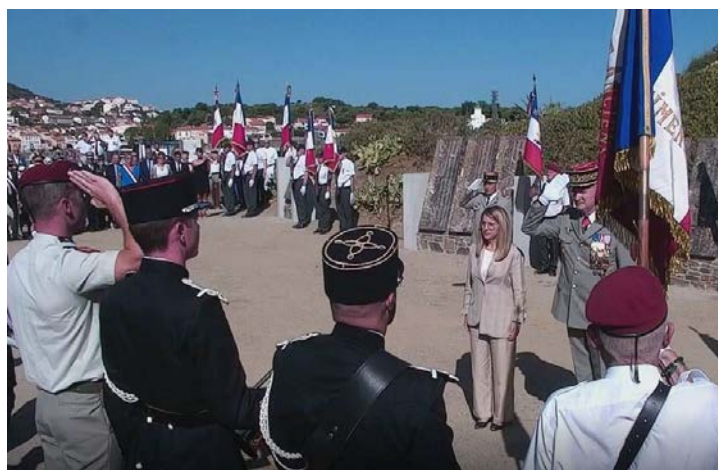
Honneurs militaires à la Secrétaire d'Etat et au général Inspecteur des armées